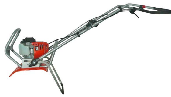
Fig. 1 B